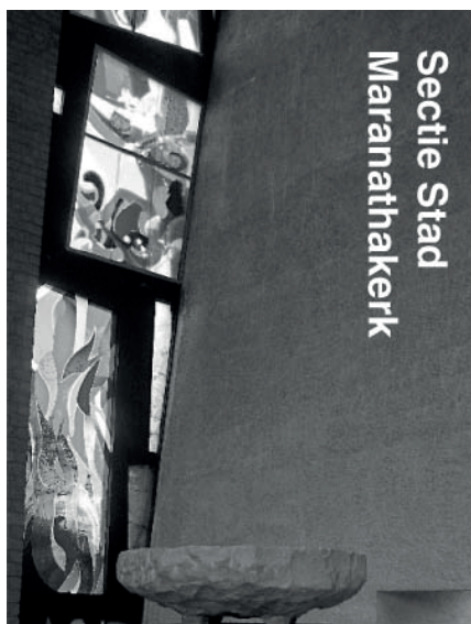
Secitie Stad Maranathakerk