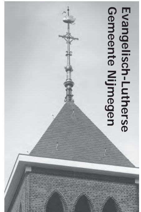
Evangelisch-Lutherse Gemeente Nijmegen

Ga hiervoor naar de website van PGN: www.pkn-nijmegen.nl (onderaan deze pagina vindt u een link naar de kerkdiensten)