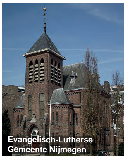
Evangelisch-Lutherse Gemeente Nijmegen