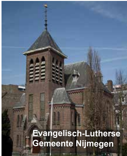
Evangelisch-Lutherse Gemeente Nijmegen