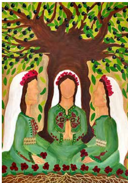
Het kunstwerk voor de Wereldsgebedsdag 2024 is gemaakt door Halima Aziz, een Palestijnse vrouw

Gedurende 24 uur vinden in de hele wereld bijeenkomsten plaats, waar dezelfde gebeden worden gebeden en dezelfde schriftgedeelten worden gelezen. Als de zon in het verre oosten opgaat over de eilanden in de Stille Oceaan, dan worden daar al de eerste diensten gehouden.