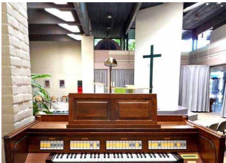
Een lege Ontmoetingskerk vanaf de orgelbank