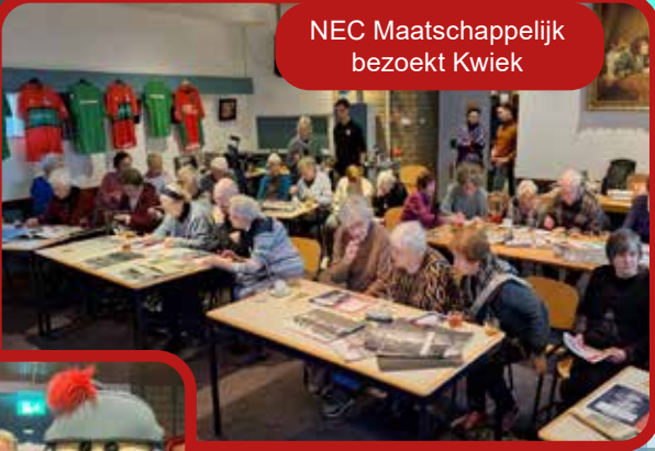
NEC Maatschappelijk bezoekt Kwiek