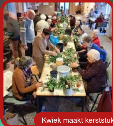
Kwiek maakt kerststukjes met groen uit de tuin