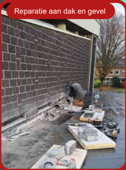
Reparatie aan dak en gevel