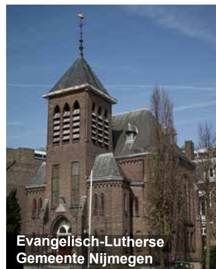
Evangelisch-Lutherse Gemeente Nijmegen