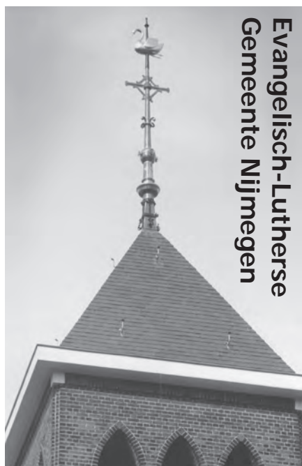
Evangelisch-Lutherse Gemeente Nijmegen