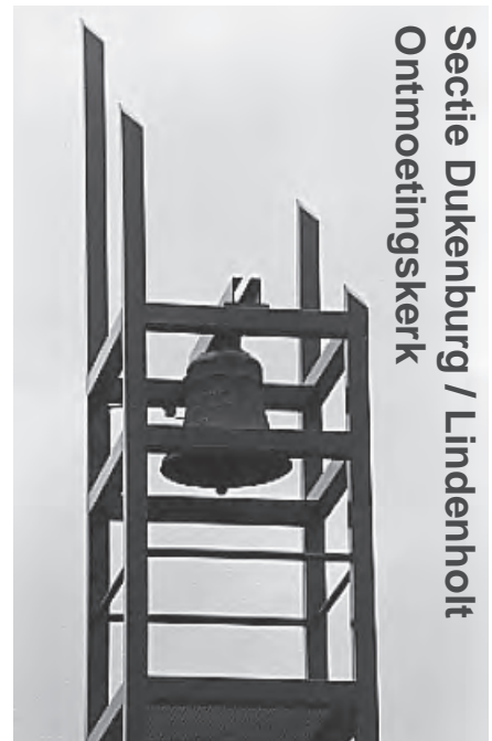
Secctie Dukenburg / Lindenholt Ontmoetingskerk

Meijhorst 70-33, 6537 EP, tel. 344 39 56