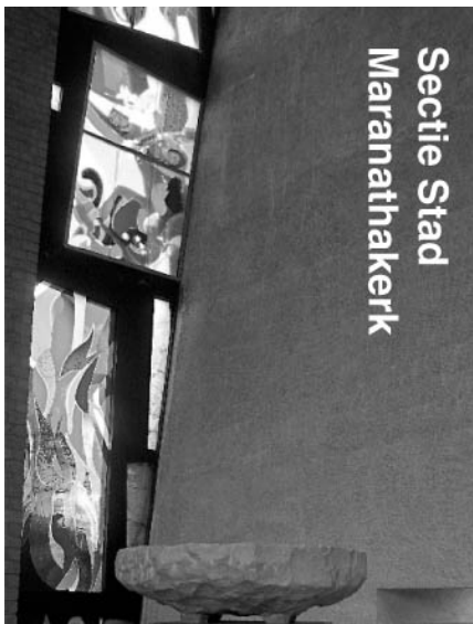
Secitie Stad Maranathakerk