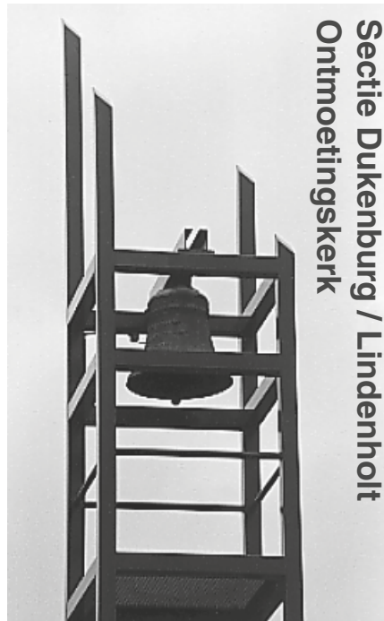
Secitie Dukenburg / Lindenholt Ontmoetingskerk

Meijhorst 70-33, 6537 EP, tel. 344 39 56